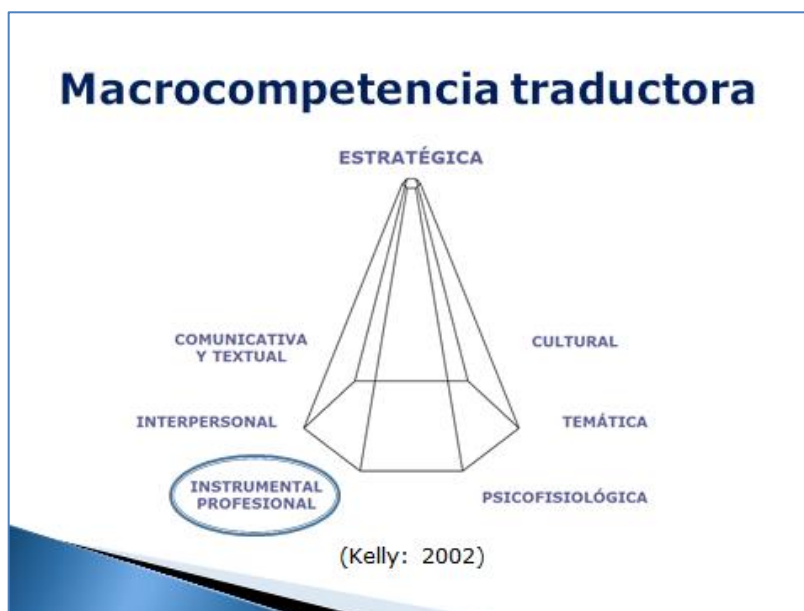
Figura 1. La macrocompetencia traductora, según Kelly (2002: 15)